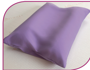
Individuell modellierbar bei hoher Formstabilität