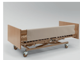
Schaumlederbezug für Seitensicherungen