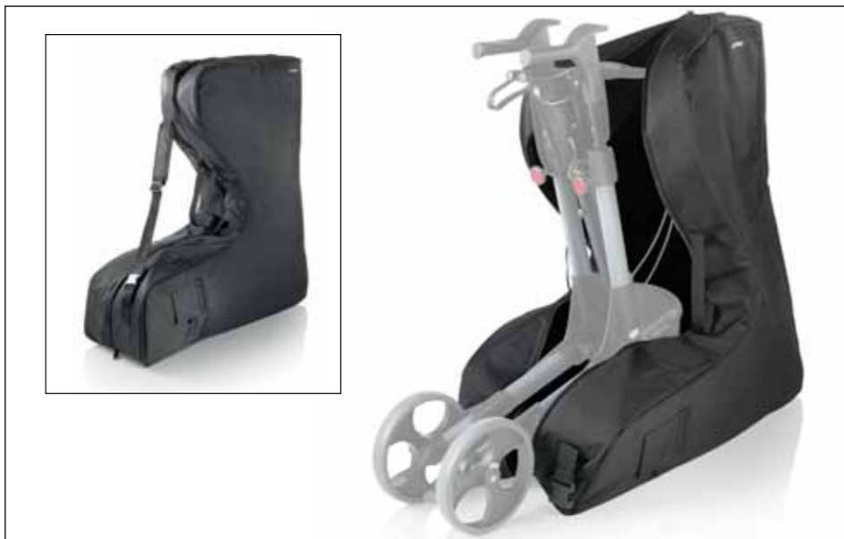
Transporttasche für die Reise in Flugzeug, Bus und Bahn Artikel-Nr. 814042 Unverbindl. Preisempf. 149,00 €