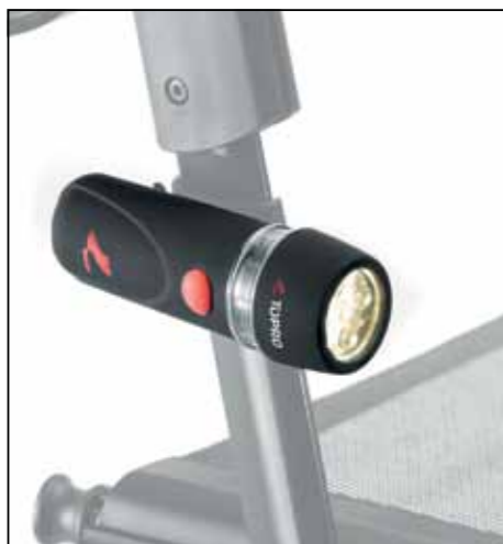
Lampe gibt Sicherheit auch in der Dunkelheit Artikel-Nr. 814608 Unverbindl. Preisempf. 23,00 €