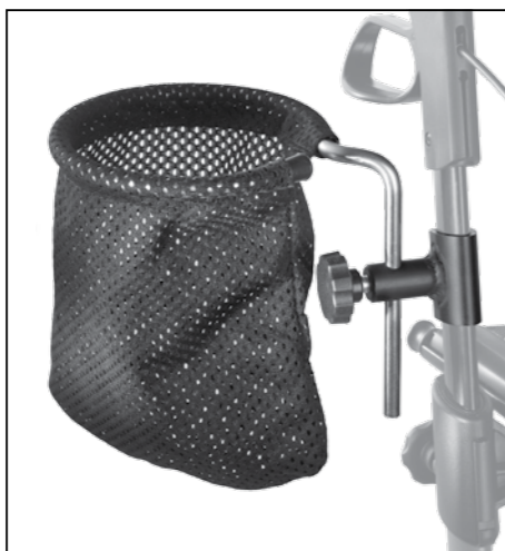
Multifunktionsnetz für die kleinen Dinge des Alltags Artikel-Nr. 814016 Unverbindl. Preisempf. 149,00 €