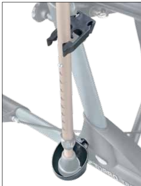
Stockhalter links oder rechts montierbar Artikel-Nr. 814025 Unverbindl. Preisempf. 37,00 €