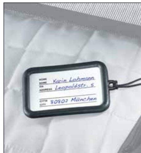
Namensschild Artikel-Nr. 814024 Unverbindl. Preisempf. 10,50 €

Aus etwas Gutem etwas Besseres zu machen ist häufig sehr schwer. Das Original TOPRO Troja Zubehör wurde genau zu diesem Zweck entwickelt. Passen Sie sich Ihren TOPRO Troja auf Ihre ganz individuellen Wünsche an. Ein breites Sortiment an Zubehör wird Ihre Bedürfnisse, Ihren Komfort, sowie Ihr ganz persönliches Sicherheitsgefühl, befriedigen.